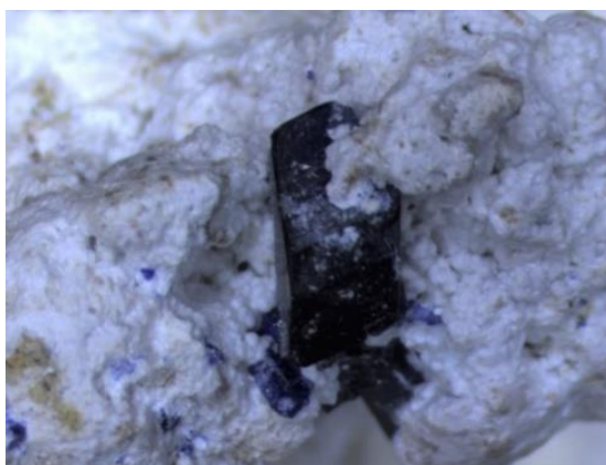
図 1 : 天然の逸見石結晶

この発見は、稀少さのために磁性研究の舞台に上がることが少なかった「日本産新鉱物」に注目するという、新しい視点を持った研究です。今後、日本産新鉱物の多様性に注目することで、驚くような物理現象の発見が期待されます。