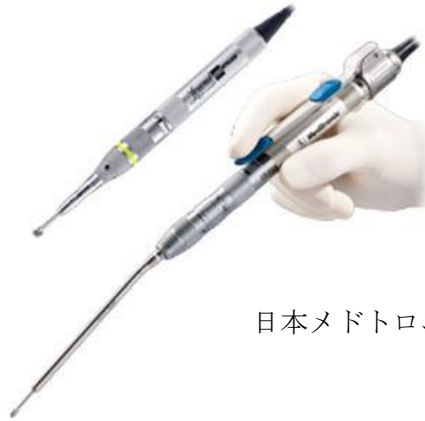
日本メドトロニック社 HP より抜粋