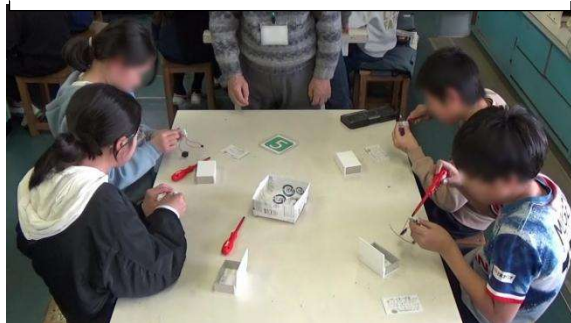
ドライバーを使って配線