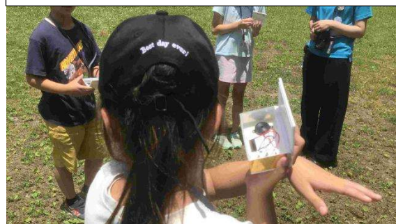
何のメロディーかな？